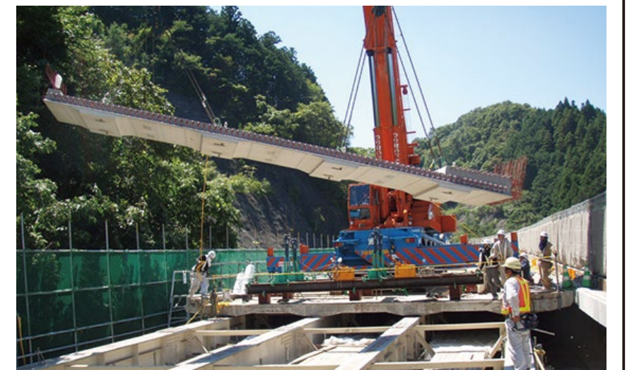
プレストレストコンクリート床版架設

損傷した床版を撤去するため、一時的に路面がなくなります。工場で製作した床版の設置に続いて舗装を行い、床版取り替えが完成します。そのため、交通規制は床版取り替えと舗装の完了後に解除となります。